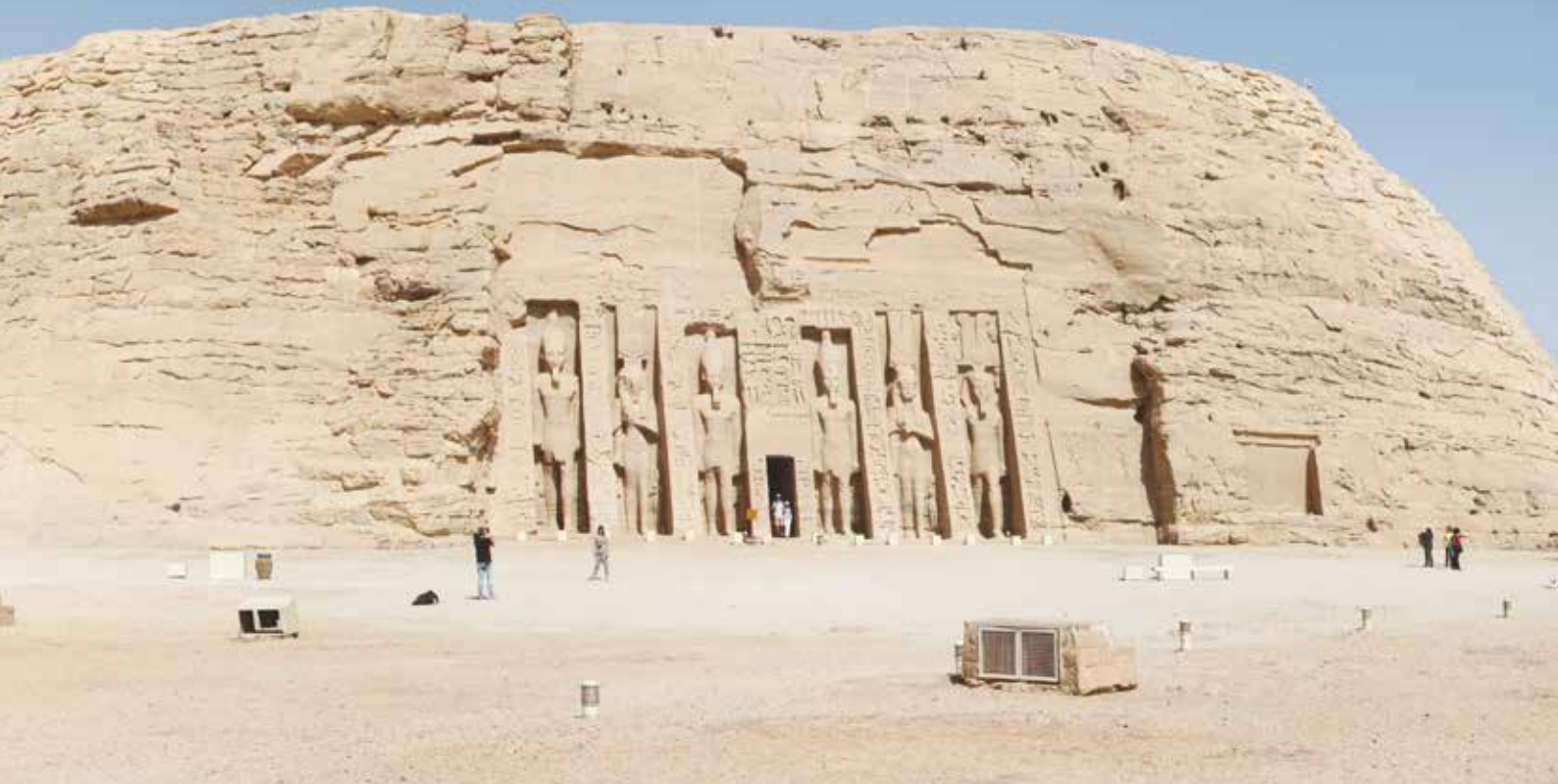
Abu Simbel, panoramica e dettaglio dei templi di Ramses